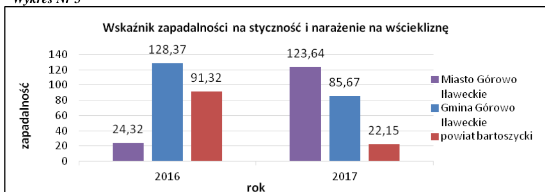
Wykres Nr 5

Na wykresie powyżej można zaobserwować, iż wskaźnik zapadalności na styczność i narażenie na wściekliznę jest najwyższy na terenie Miasta Górowo Iławeckie (123,64), a najniższy w powiecie bartoszyckim (22,15).