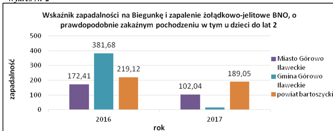
Wykres Nr 2

Analizując powyższy wykres można zauważyć spadek zachorowań na biegunkę i zapalenie żołądkowo-jelitowe BNO, o prawdopodobnie zakaźnym pochodzeniu u dzieci do lat 2, zarówno na terenie Gminy Górowo Iławeckie jak i w powiecie bartoszyckim w 2017 r. w porównaniu do roku poprzedniego.